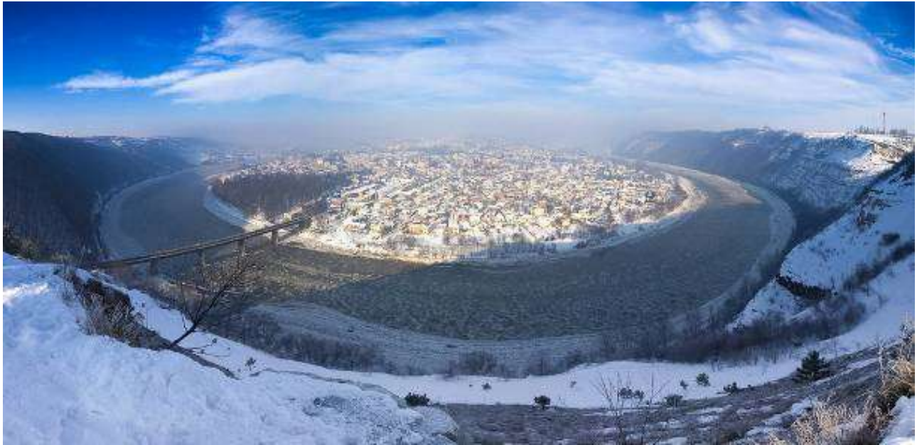
мал. 2.3. Річка Дністер місто Заліщики

Річка Нічлава відноситься до малих річок, є водним об'єктом господарсько-побутового призначення. Стік ріки (у верхній течії Нічлавка) формується на території області. Забруднення спостерігається по всій течії річки. На якість вод особливо впливають зворотні води міста Борщів, де відсутні очисні споруди. Завдяки каскаду ставків на території міста, де відбувається самоочищення води, вплив міста зменшується. В нижній течії річка має високий вміст сульфатів, чим суттєво відрізняється від інших рік регіону.