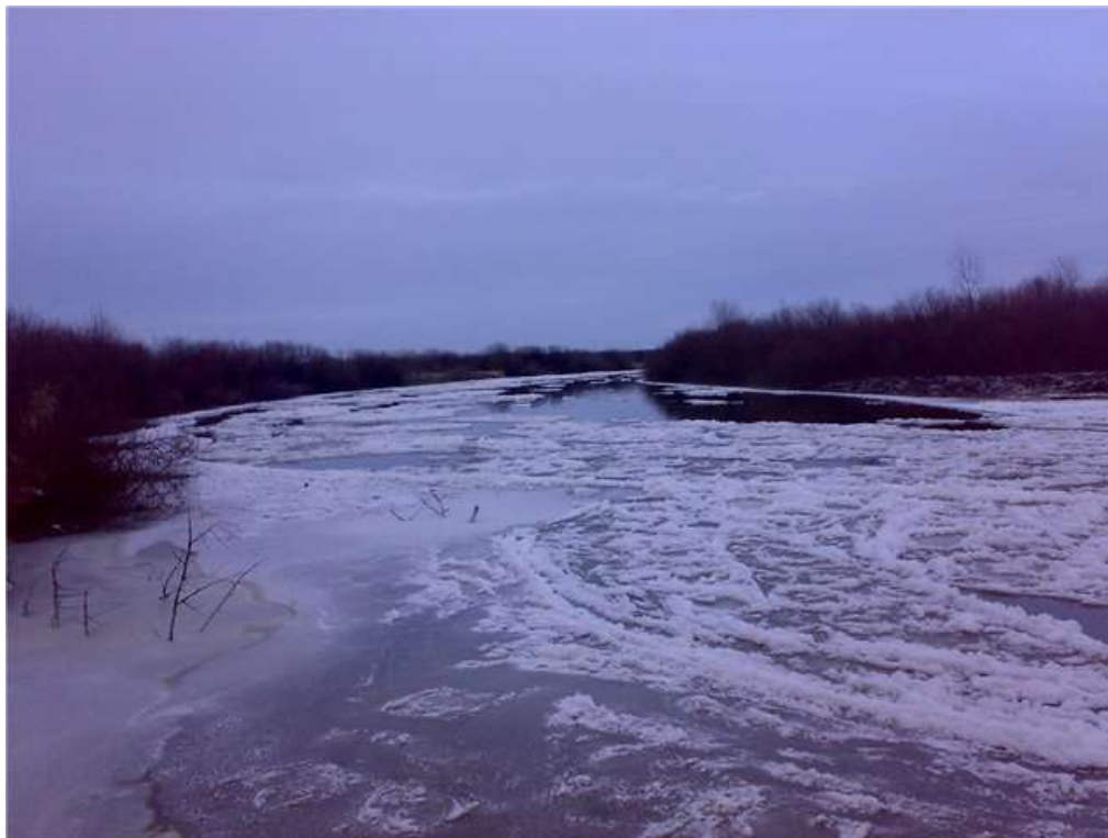
Мал. 2.5.Річка Горинь

Річка Іква відноситься до середніх річок, відноситься до басейну р.Прип'ять. Є водним об'єктом господарсько-побутового призначення. Контроль за станом р. Іква протягом січня не проводився.