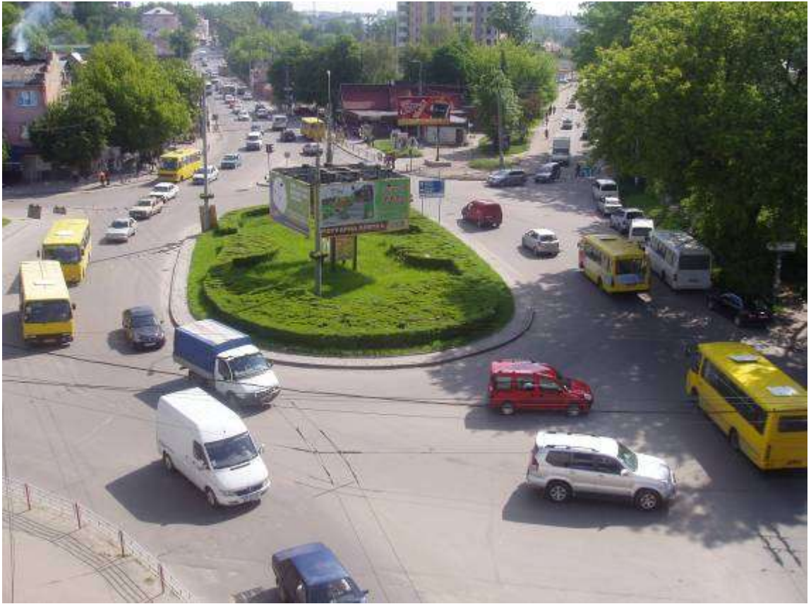
Транспортна розв'язка вулиць Збараської, Бродівської, Галицької у м. Тернопіль (стаціонарний пост спостереження за станом атмосферного повітря № 1)