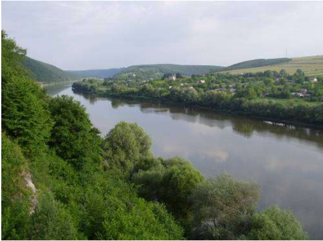
Мал. 2.2. Касперівське водосховище на річці Серет

Річка Дністер є другою за розмірами рікою України і головною водною артерією Молдови. Ріка починається в Карпатах на висоті 760 м над рівнем моря недалеко від села Вовче Турківського району Львівської області і тече спочатку на північ, а далі на південний схід через Західну Україну, Поділля. І вже недалеко від Одеси впадає у Чорне море, а точніше у Дністровський лиман. Традиційно Дністер поділяється на такі три частини: верхній (від витоків до гирла Золотої Липи), середній (від гирла Золотої Липи до гирла Реута недалеко від Дубоссар) і нижній (від гирла Реута до Дністровського лиману). Загальна довжина річки – 1352 км, площа водозабору – 72100 км 2 . Загальне падіння 759 м, середній нахил водної поверхні – 1,78%. У межах області Дністер має довжину 262 км. На схід від с. Нижнів Дністер є границею між Івано-Франківською і Тернопільською областями, а від с. Зелений Гай Тернопільської області з Чернівецькою областю. Басейн Дністра має форму вигнутого посередині овалу, довжина якого 700 км, середня ширина – 120 км. Режим ріки висвітлюється на водомірному посту в м. Заліщики, де водомірні спостереження ведуться з 1850 року. Основними елементами спостережень були рівні води і льодові явища. За характером гідрологічного режиму залежить від своїх приток – річок Карпатської зони і Поділля. Найбільше значення в режимі Дністра мають Карпатські притоки, які його й визначають.