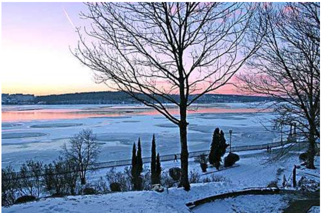
Мал. 2.1. Тернопільський став

Контроль за станом р. Серет Тернопільського водосховища проводився 25 січня 2018 року Тернопільським обласним управлінням водних ресурсів від створу, який знаходиться в м.Тернопіль 180 км (Тернопільське водосховище).