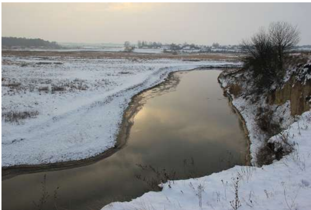
Мал. 2.6. Річка Іква

Річка Іква відноситься до середніх річок, відноситься до басейну р.Прип'ять. Є водним об'єктом господарсько-побутового призначення. Контроль за станом р. Іква протягом січня не проводився.